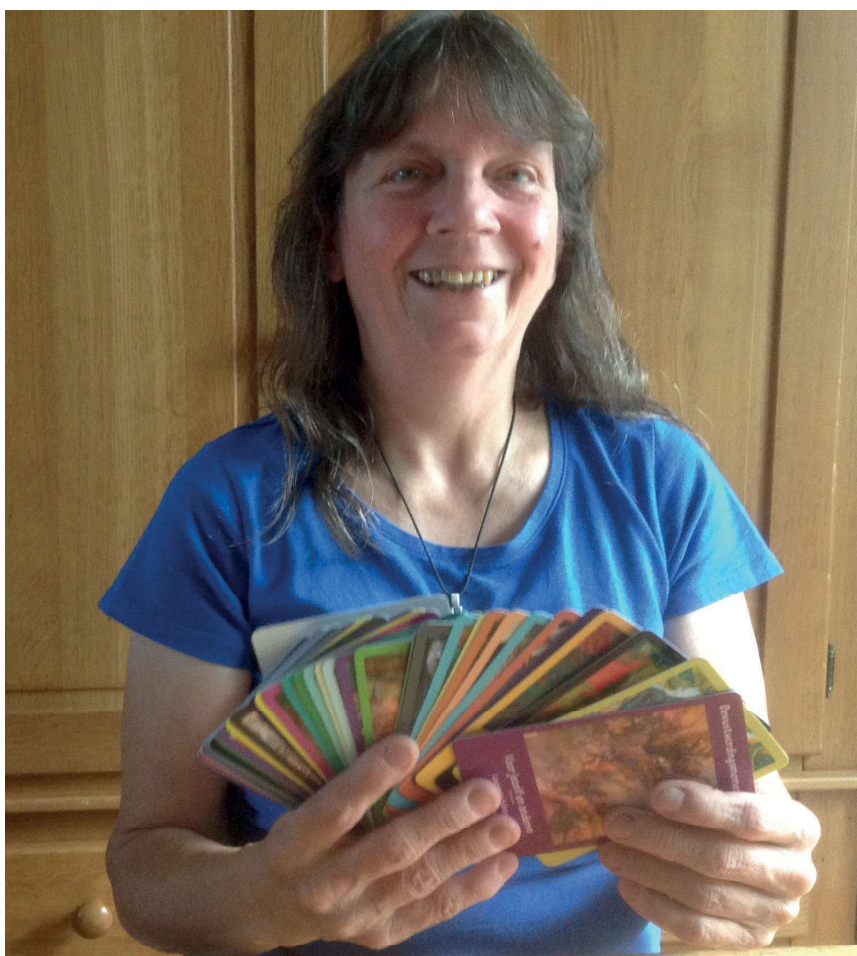
Hier sta ik met mijn zelfgecreëerde kaartendeck

gen die gebeuren, die ik lees of hoor, of door gesprekken met mensen, krijg ik steeds weer inzichten om over te schrijven. Ik probeer ze niet te lang te maken en gemakkelijk leesbaar met eenvoudige woorden, zoals ook ik eenvoudig ben. Dit boek is het resultaat van 1 jaar wekelijks een thema wat 52 stukjes zijn geworden.